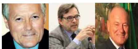
Il Consiglio Direttivo del Consorzio CEV

Per visualizzare la versione web è necessario accedere al sito ceV